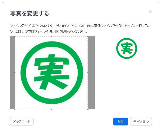
図 4 写真を変更する