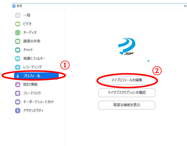
図 2 Zoom の設定画面