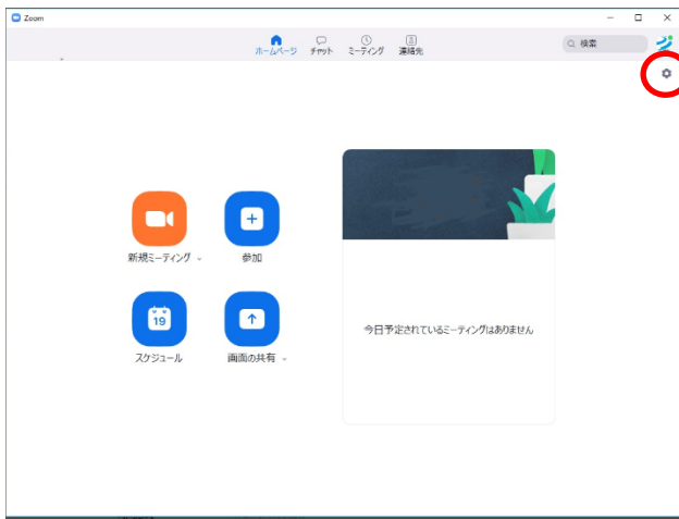
図 1 Zoom のアプリを立ち上げたところ