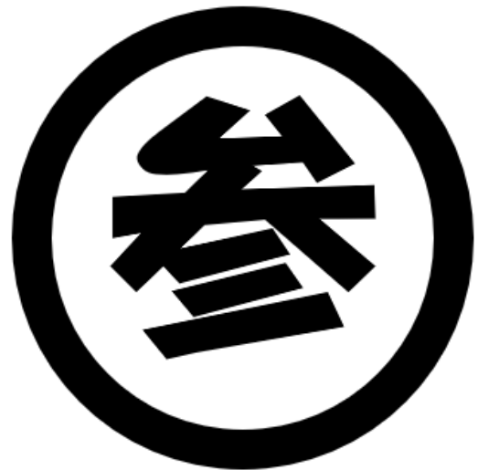
聴講者用アイコン